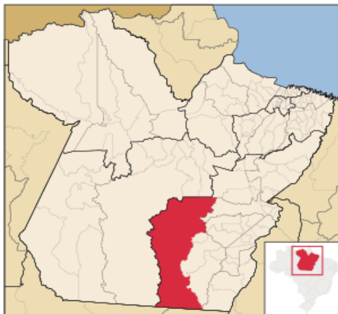
01: Localização do Município de São Felix do Xingu.