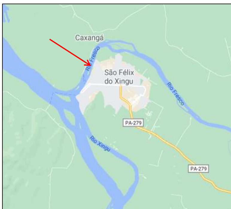
02: Local de implantação da ponte sobre o Rio Fresco ligando São Felix do Xingu ao distrito de Taboca.