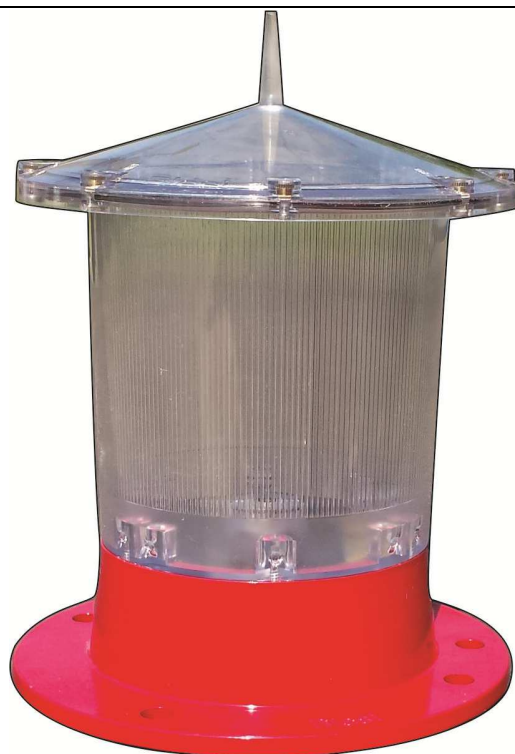
TM - PRODUTO PATENTEADO

Com quase 20 anos de Mercado Nacional, as Lanternas para Sinalização Náutica fabricadas pela BLEST do Brasil, são compactas, autônomas e seu funcionamento é totalmente automático.