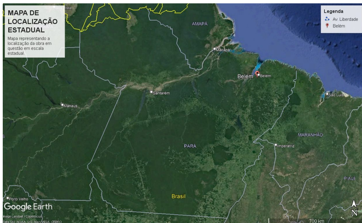
Figura 1 – Mapa de localização estadual

A via em questão tem como finalidade fornecer uma alternativa de entrada e saída da Região Metropolitana de Belém – RMB, que hoje conta somente com a rodovia BR-316 para este fim, assim proporcionando maior fluidez, segurança e conforto às viagens da região. A avenida que será construída interligará diretamente Belém à Marituba por meio de uma via expressa, com cerca de 13,3 quilômetros de extensão, passando paralelamente ao sul da rodovia BR-316, representando o potencial de atrair viagens que hoje circulam no trecho urbano da rodovia federal, o que proporcionará na redução do congestionamento e facilitará o fluxo de veículos.